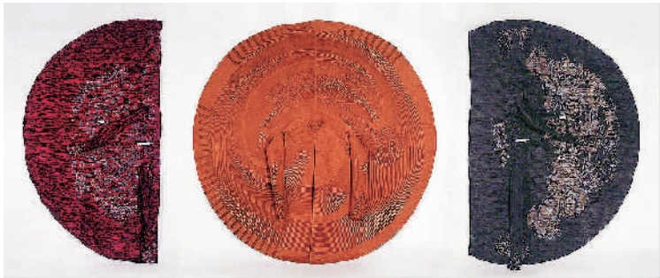
盈一亏一长 姜绥祥 苑国祥 杨妍丽(中国香港)