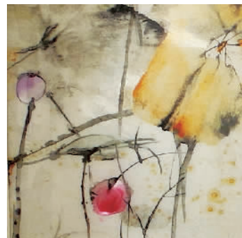
荷韵 洪兴宇 丁剑欣(中国)