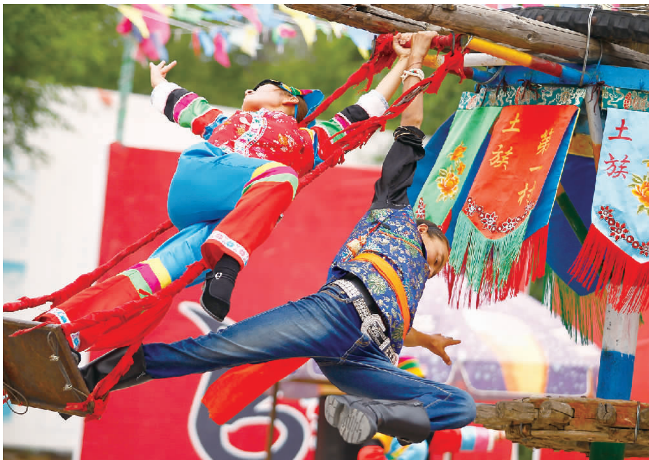
土族“轮子秋”——一种庆祝丰收的仪式